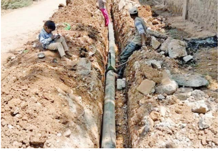
સુરેન્દ્રનગર, સુરેન્દ્રનગર શહેરમાં રૂ. ૫૬ કરોડના ખર્ચે પાણીની પાઈપલાઈન નાખવાની કામગીરી કાચબાગતિએ ચાલી રહી છે. બીજી તરફ આયોજનના અભાવે ધોળી ધજા રેમમાં પાણી હોવા છતાં સુરેન્દ્રનગરની ર લાખ જનતાને તરસે મરવાનો વારો આવ્યો છે. આ અંગે જીયુડીસી કંપનીને

ત્રણ વારેડલાઈન આપવા છતાં કામગીરી પૂર્ણ ન થતાં મામલો હવે ગાંધીનગર પહોંચ્યો છે. સુરેન્દ્રનગરમાં રૂ. ૫૬ કરોડના ખર્ચે પાણીની લાઈન નાખવાનું કામ જીયુડીસીને આપવામાં આવ્યું હતું. પરંતુ આયોજનના અભાવે કંપની ૩-૩ વારે ડેડલાઈન ચૂકી જતાં હાલ પંચકની ર લાખથી વધુ જનતાને તરસે મરવાનો વારો આવ્યો છે. અનેકવાર સ્થાનિકો દ્વારા સ્થાનિક કક્ષાએ રજૂઆત કરી પણ જીયુડીસીનો તમામ વહીવટ ગાંધીનગરથી થતો હોય અહીયાના અધિકારીઓને તેઓ ગણકારતા જ નથી. જો કે, હાલમાં પાણીના પોકારો પડતા સરકાર દ્વારા દરેક જિલ્લામાં પાણીની સ્થિતિ જાણવા માટે ખાસ મંત્રીને જવાબદારી સોંપાઈ છે. જે અંતર્ગત રાજ્યના શ્રમ અને રોજગાર મંત્રી દિલીપ ઠાકરે સુરેન્દ્રનગર આવી પહોંચ્યા હતા. જ્યાં સુરેન્દ્રનગર પાલીકાની ટીમે સ્પષ્ટ કહી દિધું હતું કે, અમારા ડેમમાં તો પાણી છે પરંતુ જીયુડીસીએ નવી લાઈનનું કામ પુરું ન કર્યું હોવાને કારણે શહેરમાં હાલ બે દિવસે પાણી આપી શકીએ છીએ. જેની મંત્રીએ જાણીને તરત જીયુડીસીના અધિકારીઓને જીયુડીસીના અધિકારીઓને ગાંધીનગરની સુચનાનું વિષય બની ગયો છે. ઉપરાંત જિલ્લાના એવા ઘણા ગામડાં છે જ્યાં નર્મદાના નીર પહોંચ્યા નથી. તેવા ગામોમાં પાણી આપવા માટે તાકિદ કરાઈ છે.